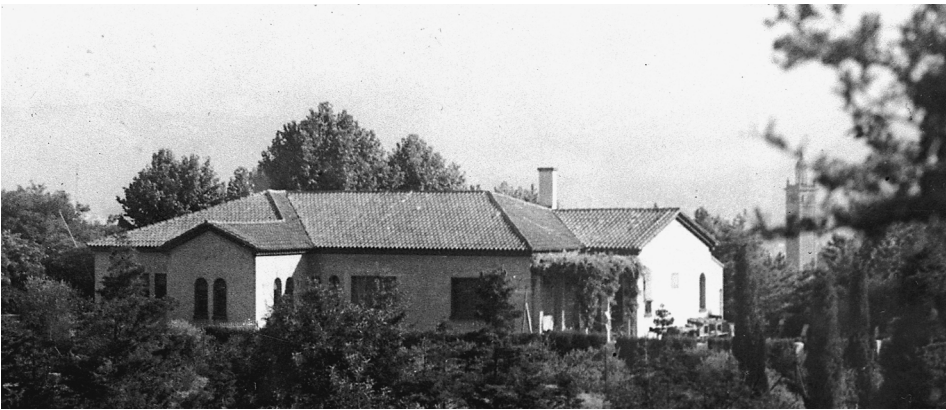
Edifici de l'Exposició Internacional del 1929, que fou la seu de l'Institut Botànic entre el 1940 i el 2003